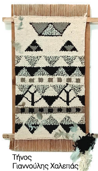
Τήνος Γιαννούλης Χαλεπάς